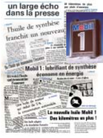
1977 Lancement de la Mobil 1