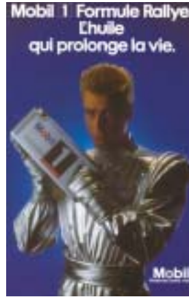
1985 Lancement de la nouvelle "Mobil 1 Formule Rallye"