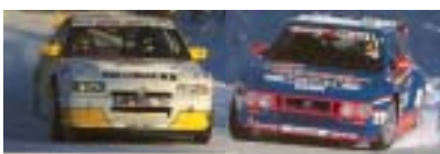
1993 Premiers partenariats sportifs avec Méga et Opel (Trophée Andros)