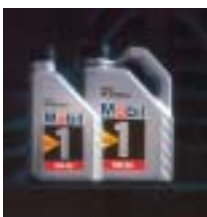
1992 Lancement de Mobil 1 nouvelle formule