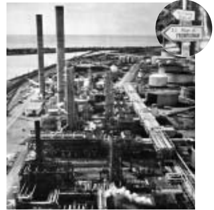
1986 Abandon des opérations de transformation à Frontignan. Le site devient un dépôt