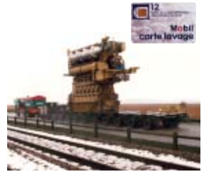
1991 1re carte à puce de lavage 1991 Mise en route du moteur marin "Explorer" (puissance : 5 500 CV, poids : 100 tonnes)