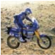
1987 Moto : signature d'un contrat de partenariat avec Yamaha Motors France