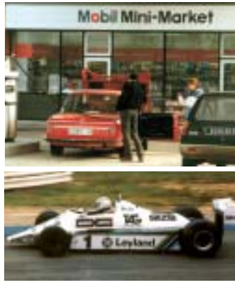
1979 Ouverture des "Mobil mini-market" en self-service dans les stations-service 1981 Formule 1 : Williams champion du monde des constructeurs avec Mobil 1