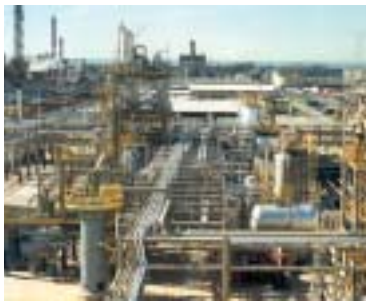
1988 Construction de nouvelles unités de polyalphaoléfinés pour la fabrication des lubrifiants synthétiques à Notre-Dame-de-Gravenchon