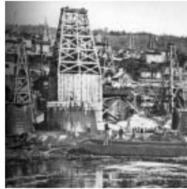
1865 Oil Creek, Pennsylvanie